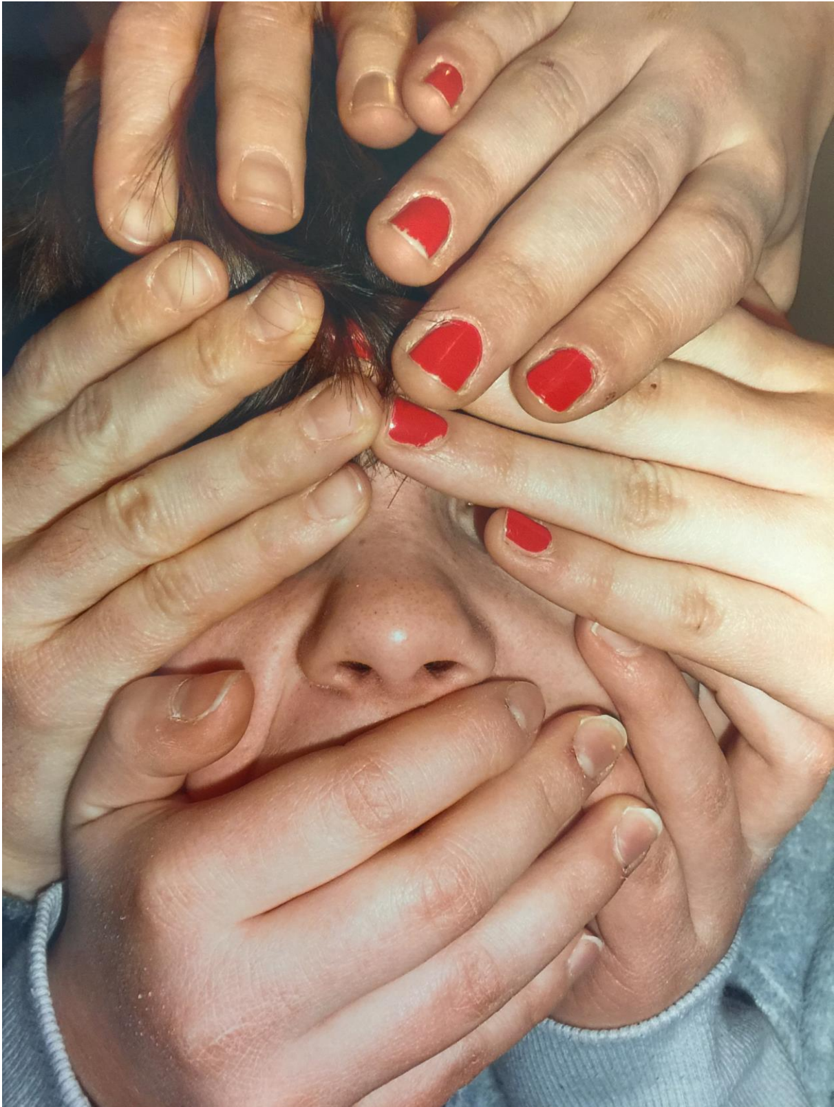
Abbildung 4: „Den Finger aus der Nase nehmen...“: Das Foto zeigt ein von sechs Händen verdecktes Gesicht, lediglich die Nase ist zu sehen.