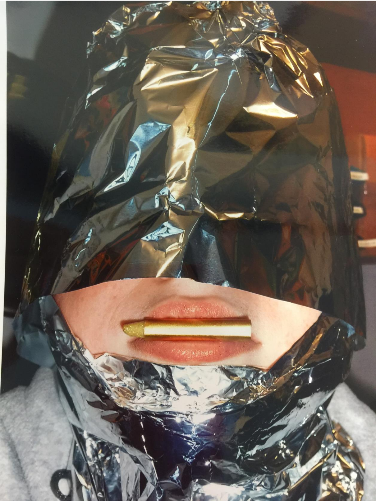
Abbildung 1: „Reden ist Silber, Schweigen ist Gold“: Die blinde Schülerin hat ihren Kopf mit silberner Rettungsfolie umhüllt, lediglich der Mund ist nicht verdeckt. Zwischen den Lippen hält die Schülerin etwas Goldenes.