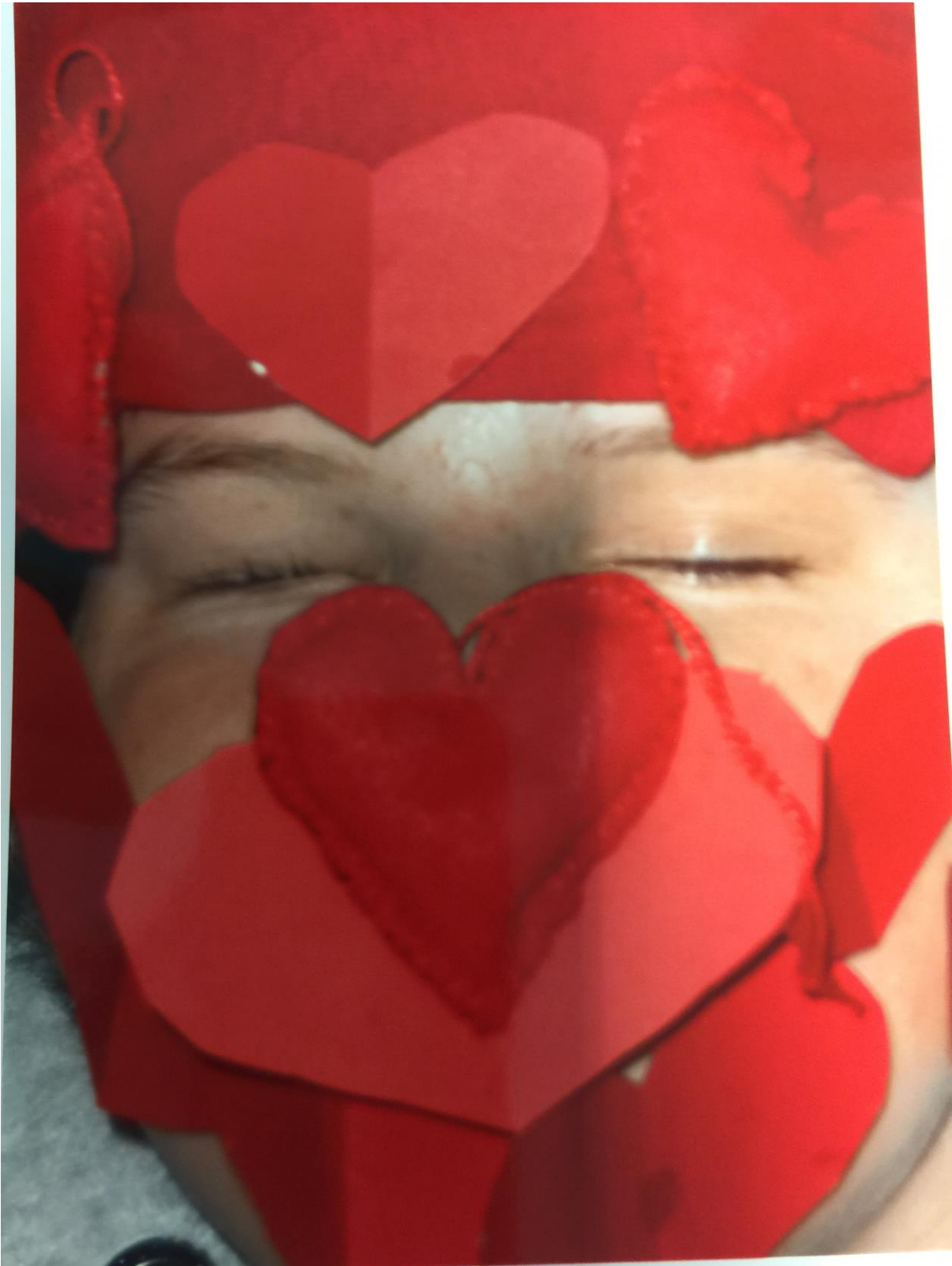
Abbildung 3: „Man sieht nur mit dem Herzen gut...“ – Der Kopf des Mädchens ist frontal zu sehen, aber bis auf die Augen mit roten, übereinander liegenden Pappherzen verdeckt. Die Augen sind geschlossen.